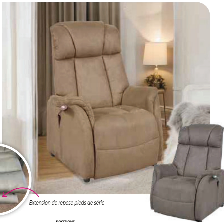
Extension de repose pieds de série