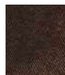
CHOCOLAT (REF. 1340)