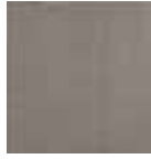
Gris Eléphant (Réf. 208-11) 3701183220816*