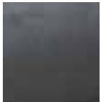
Gris Cendré (Réf. 208-10) 3701183208104*

Test Martindale résistance à l'abrasion >35 000 tours.